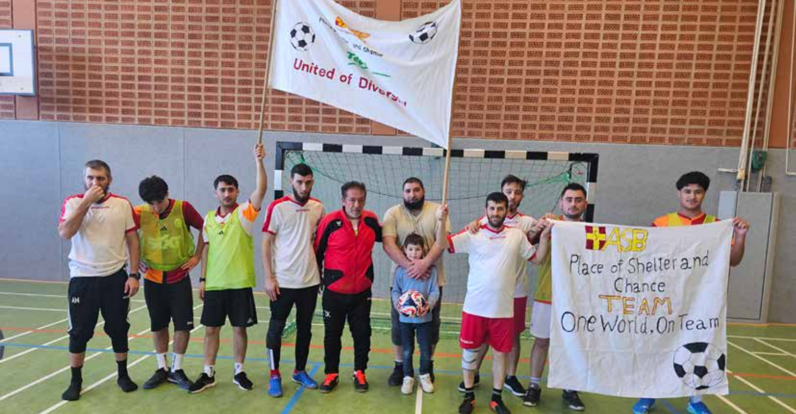
Die beiden Mannschaften aus dem ASB-Place of Shelter and Chance beim Integrationscup in Eschershausen.