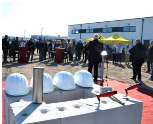
Viele Gäste kommen zur feierlichen Grundsteinlegung.

Zentrum für Soziale Dienste fertig, danach wollen wir hier voraussichtlich 2027 oder 2028 eine weitere Tagespflege für Barsinghausen ansiedeln“, kündigte Jens Meier an.