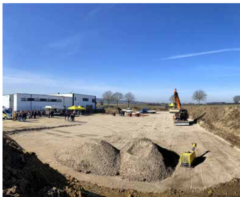
Auf diesem Grundstück entsteht das Zentrum für Soziale Dienste.