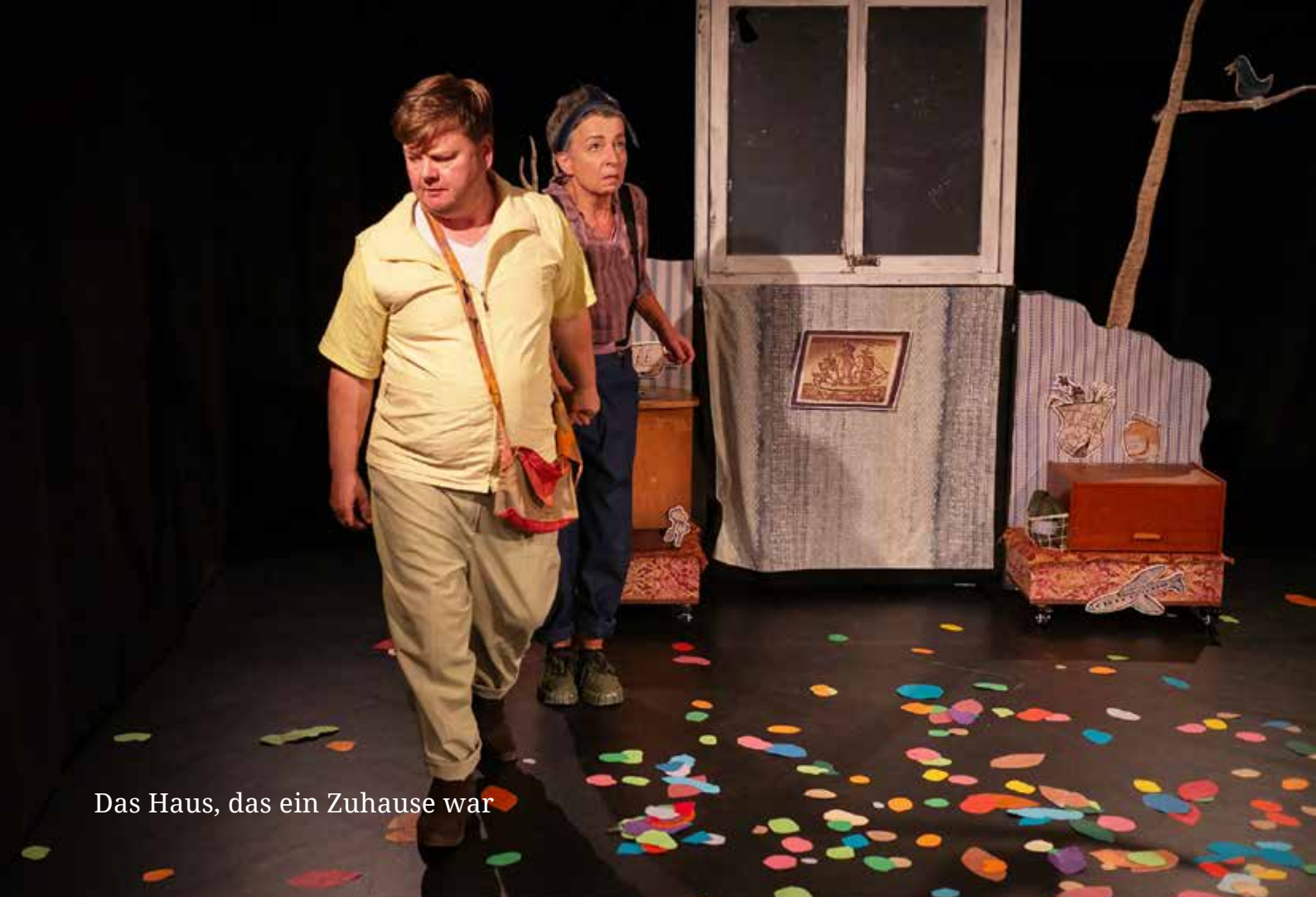
Das Haus, das ein Zuhause war